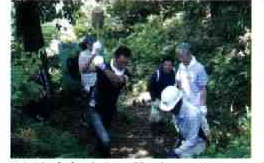
広陵小の学校林“もりつく” 整備中の地区住民の方々