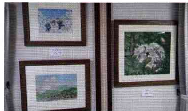
川上画伯の童画作品