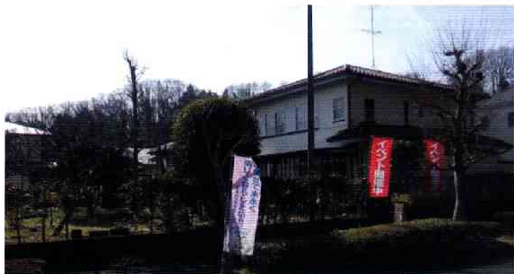
サロン&ギャラリー会場全景