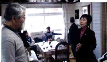
林自治会長、野元市議会議員