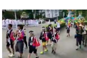
若葉台内を練り歩く子どもたちの万燈と神輿