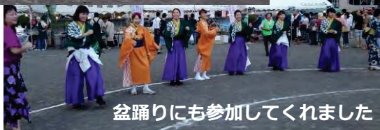
盆踊りにも参加してくれました

若葉台住宅を考える会はピンクのビブス（ユニフォーム）を初着用。おにぎりや茹でトウモロコシ、飲料等を販売しました。