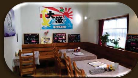
店内はカフェ風 全席イス席です