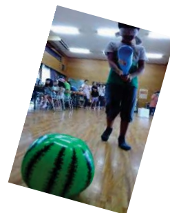
うまく当たるかな？