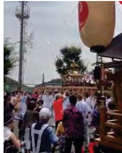
会館中庭での神輿

提灯飾りなど事前準備をやって頂いた方々、当日みこしを担いだ方々、会館で大勢の接待に大忙しだった方々、子ども会の方々など諸担当の皆様方におかれましては本当にご苦労様でした。