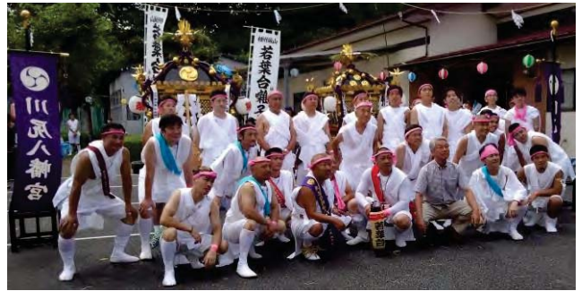
神輿を担いだ若葉台の面々