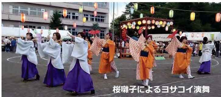
桜囃子によるヨサコイ演舞

各団体の模擬店はどこも好調だったようでじいちゃん、ばあちゃんの家遊びに来ていた小さいお子さん方やお父さん、お母さんたちも喜んでくれました。関係者の皆様方、大変お疲れさまでした。