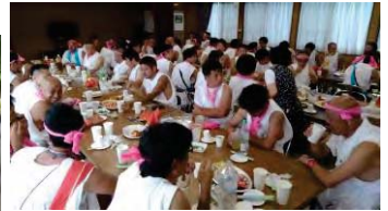
会館ホール内は休息をとる各地の担ぎ手さんで満席